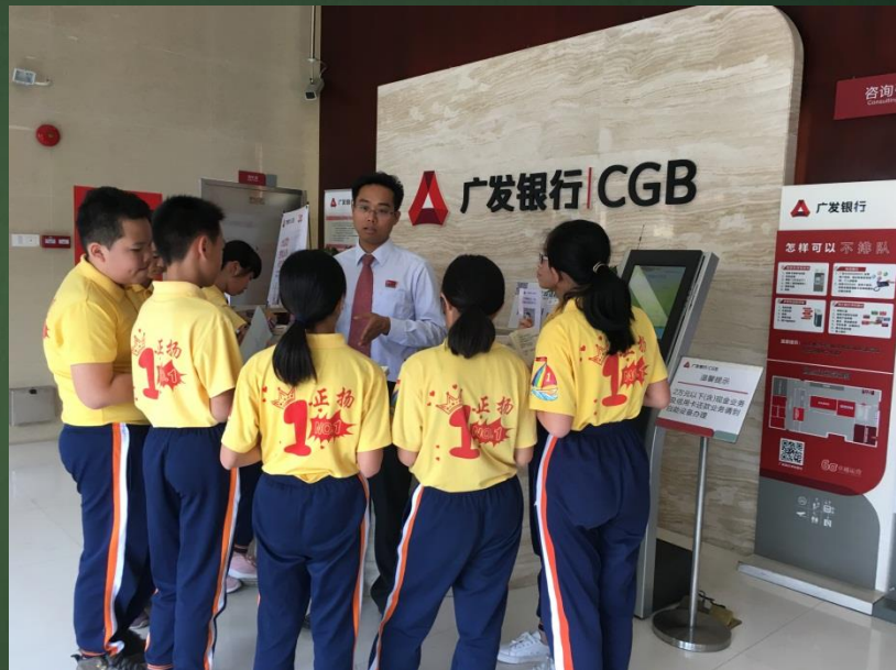
社团到广发银行开展“我是理财小能手”实地探究活动