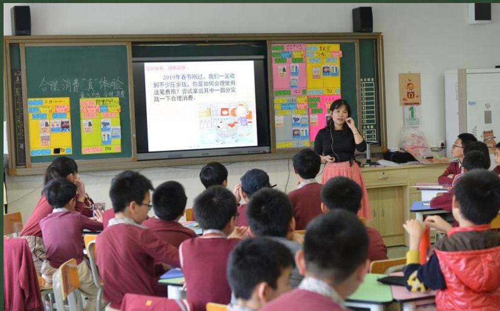
在省研讨会上展示课例