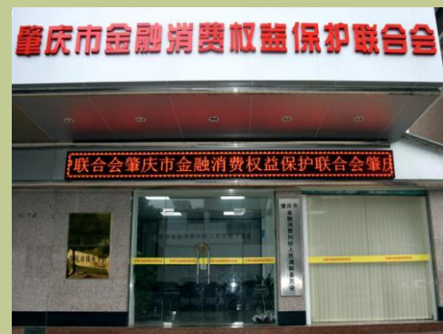
肇庆市金融消费权益保护联合会