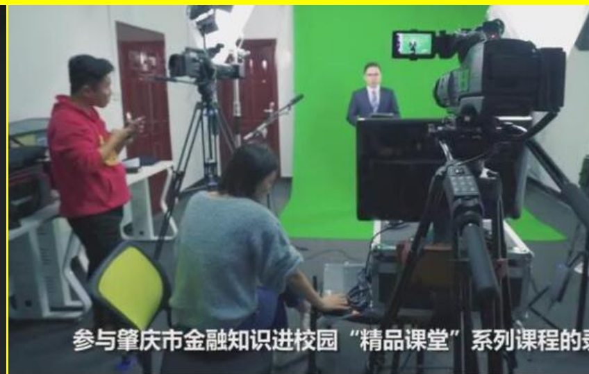
参与肇庆市金融知识进校园“精品课堂”系列课程的录

课程六：恰当存款让钱生钱 课程七：购买保险规避风险 课程八：谨防利用金融工具诈骗 课程九：学会家庭收支管理 课程十：关注互联网金融