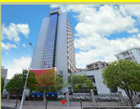
人民银行肇庆市中心支行