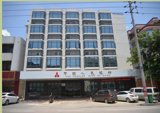
人民银行怀集县支行