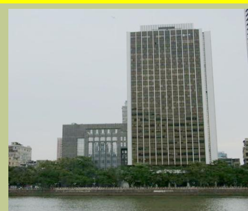
人民银行广州分行