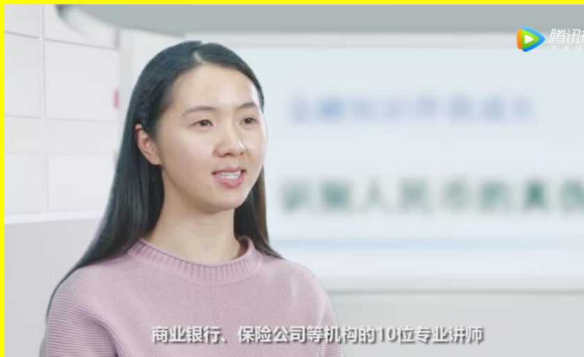
商业银行、保险公司等机构的10位专业讲师