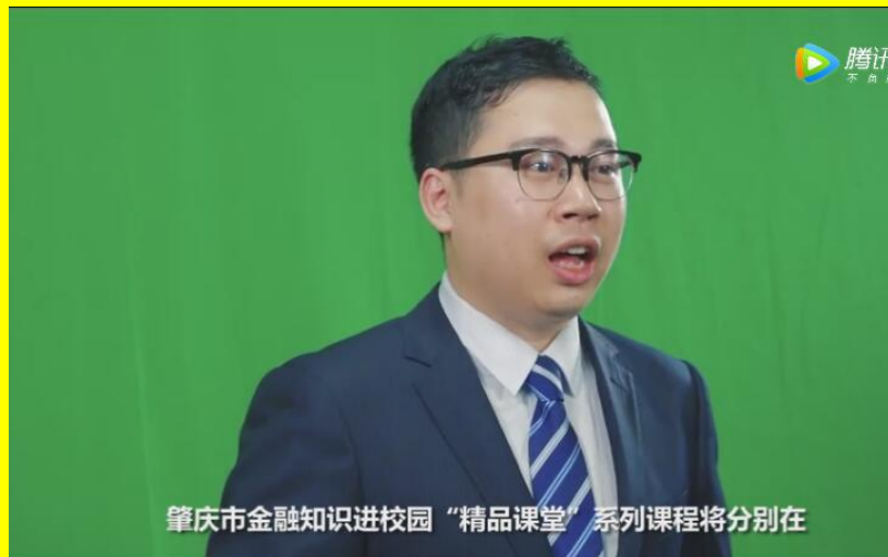
肇庆市金融知识进校园“精品课堂”系列课程将分别在

2017年，肇庆市金融消保联合会邀请10位金牌讲师录制了“精品课堂”系列教学视频，实现了将课堂电子化和网络化，并上线供学校教师教学和学生自学使用。