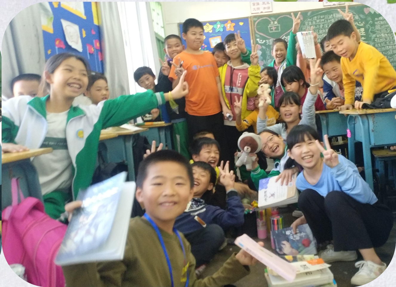
“我学会了理财”课堂模拟自由市场