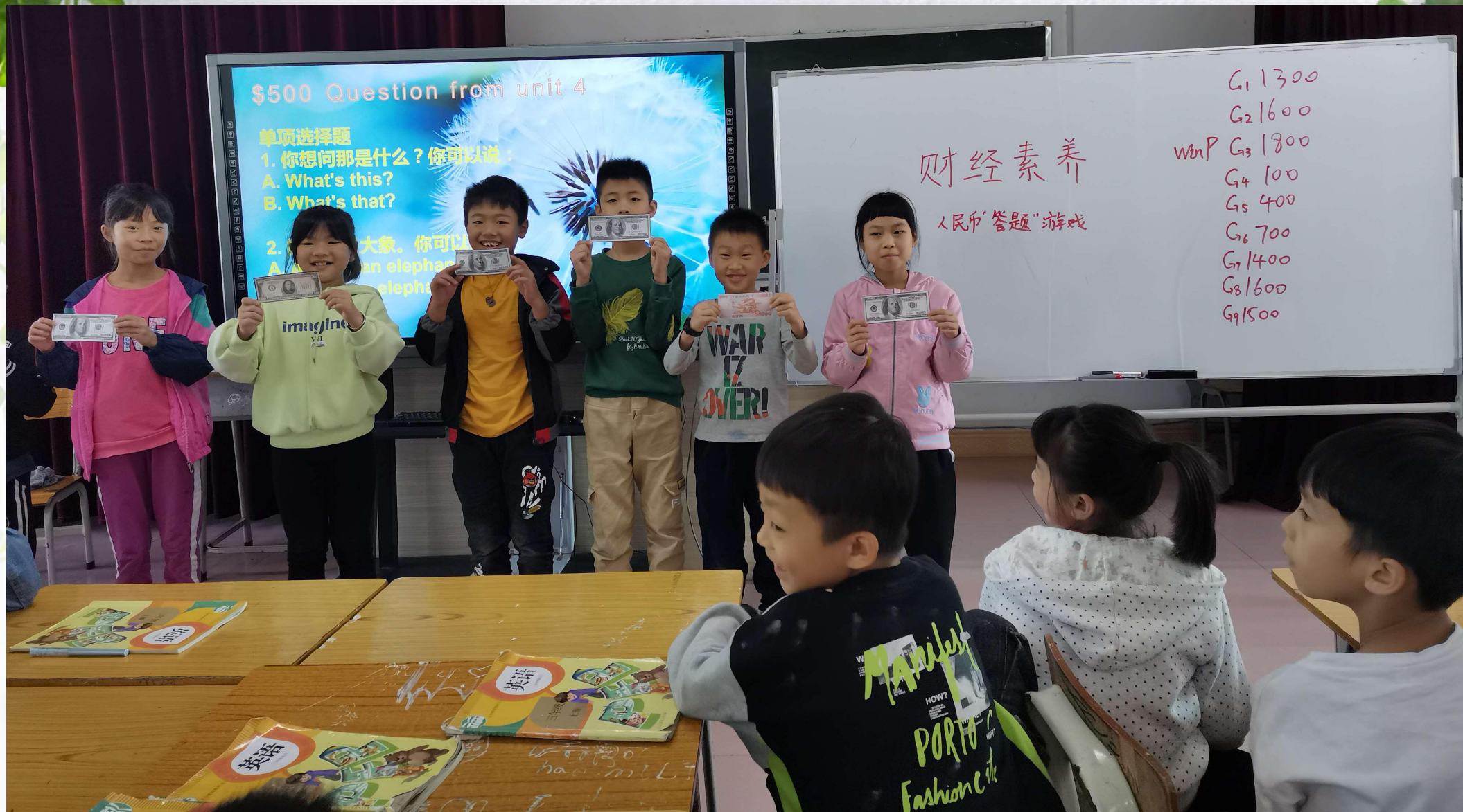
jeopardy游戏: 拥有金额最多的小组分享胜利的喜悦