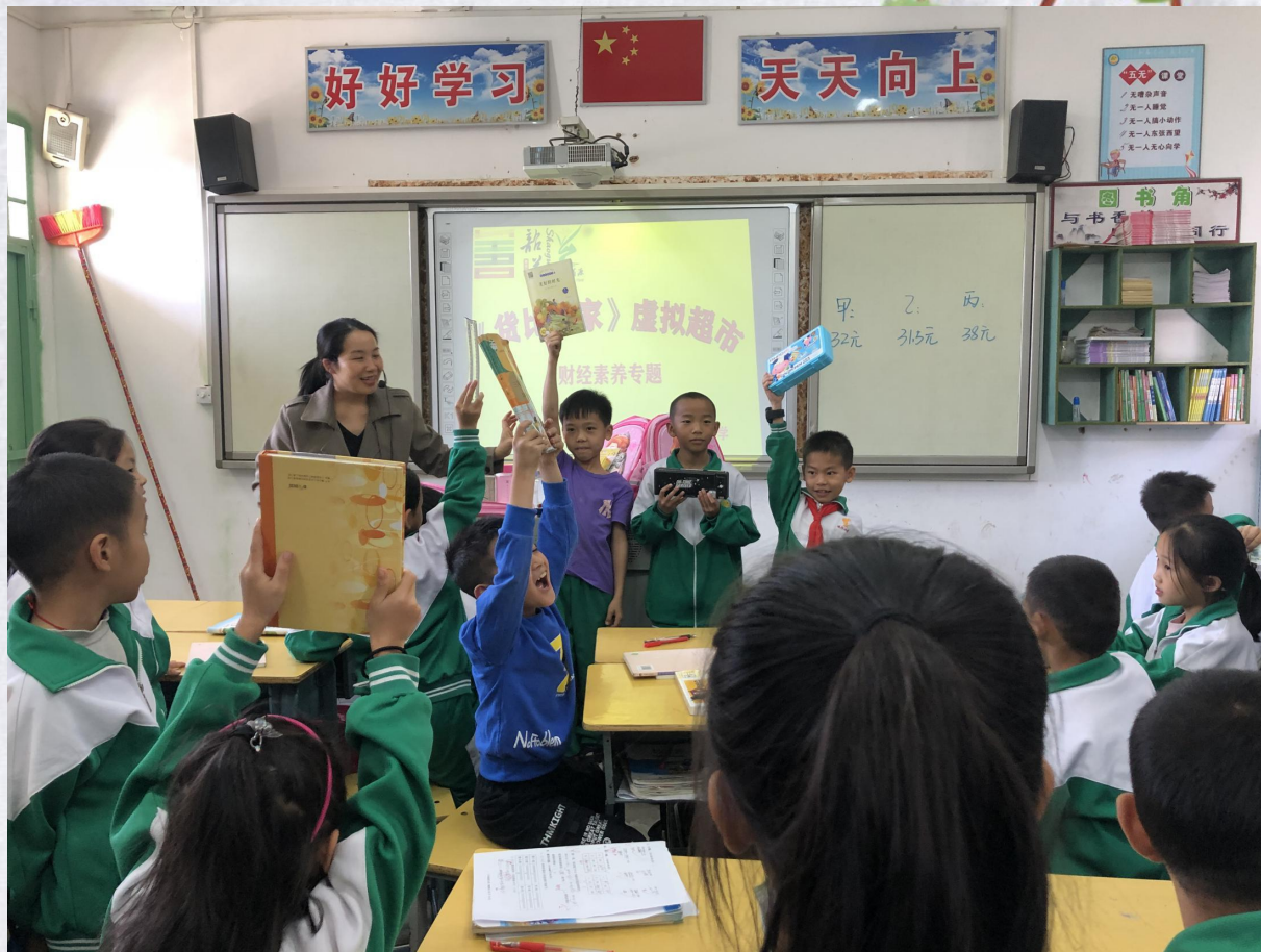
《货比三家》课堂活动图