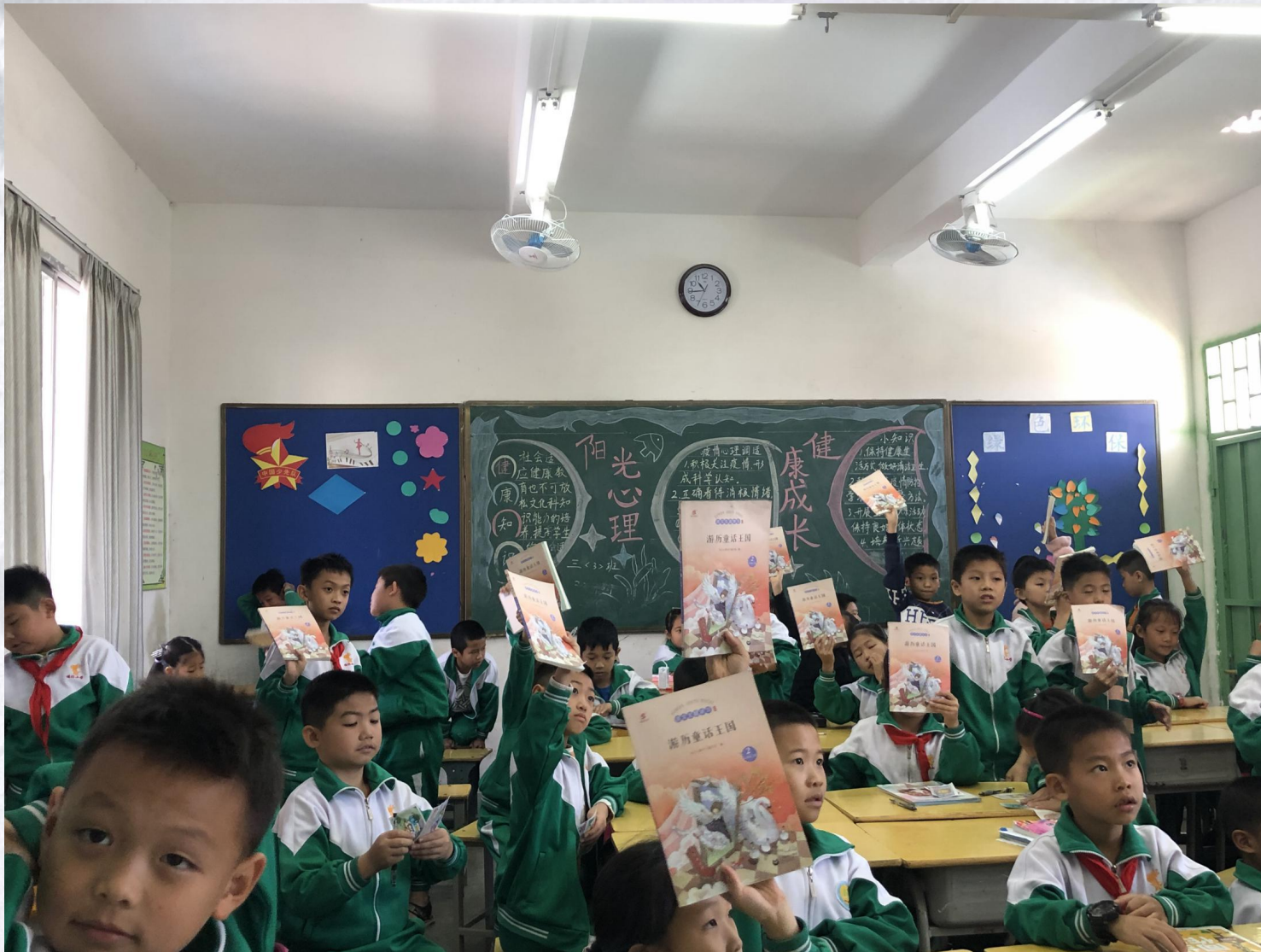
《货比三家》课堂活动图