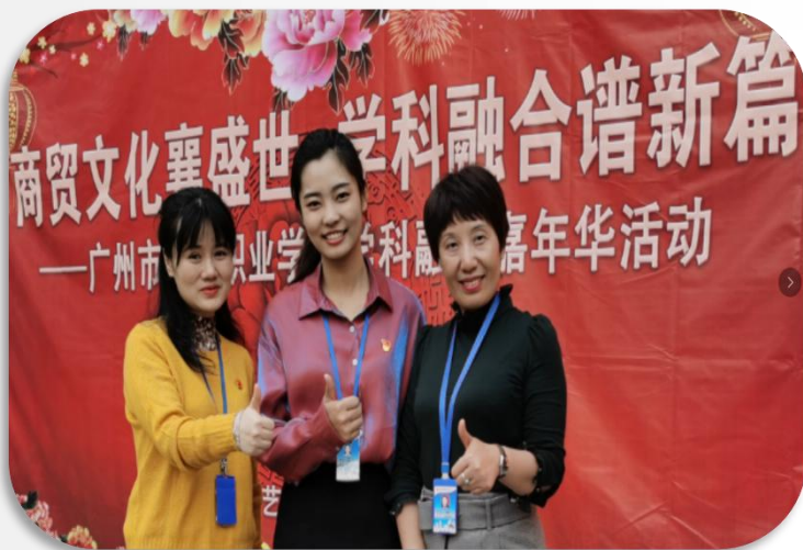
跨学科融合嘉年华活动