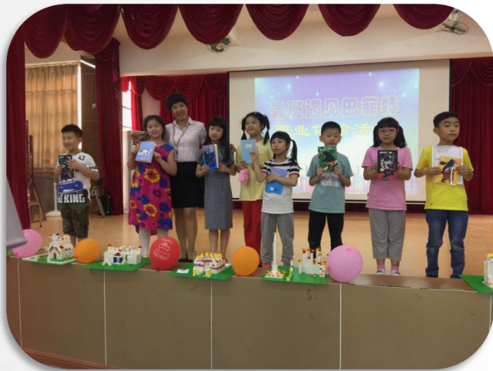
广州市协和小学家长及师生共同参与