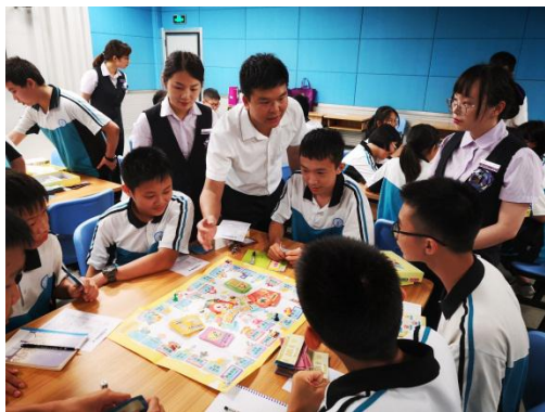
银行工作人员教我们玩 “大富翁”游戏