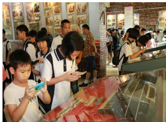
高明钱币博物馆研学