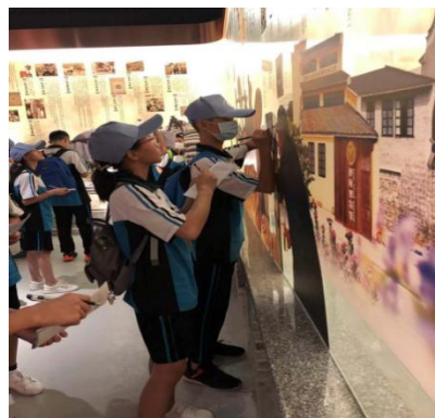
十三行博物馆研学