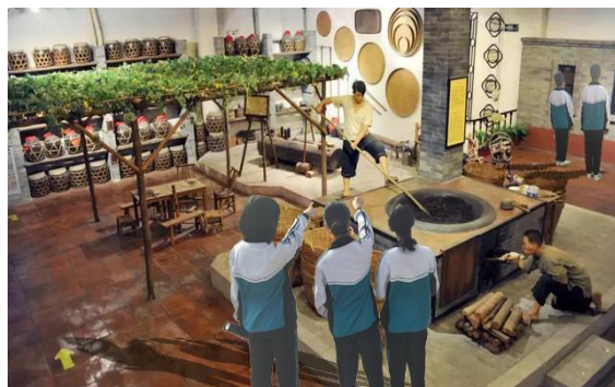
陈李济博物馆研学