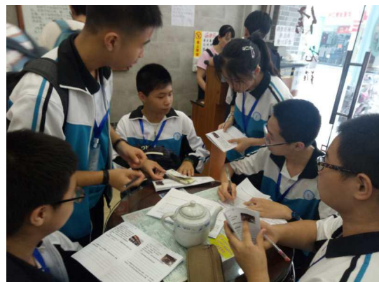
寻味顺德研学——我会理财活动