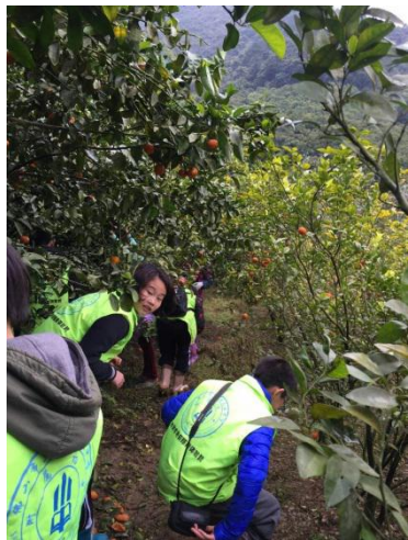
郁南森美村农耕研学