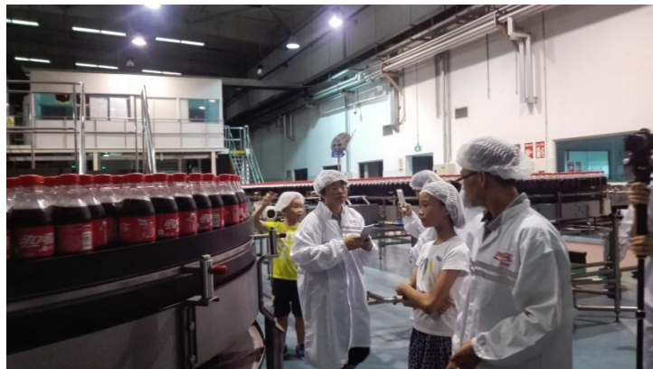
可口可乐生产基地研学