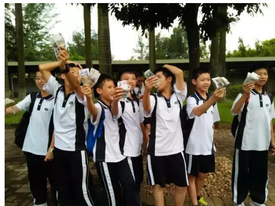
寻访旧街研学——一元生存挑战活动