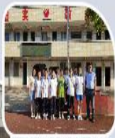
第一届财经社领导机构成员合影