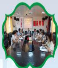
温中校长在课题组工作会议上作指导性发言