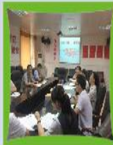
“校企合作”工作会议现场