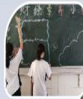
学生出版财经素养主题海报