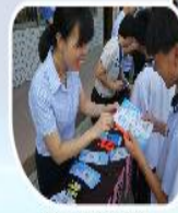
学生认真了解新金融知识