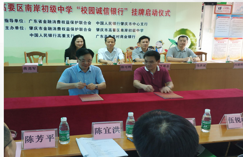
“诚信银行”签约仪式