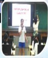
学校财经社组建首届会员大会现场