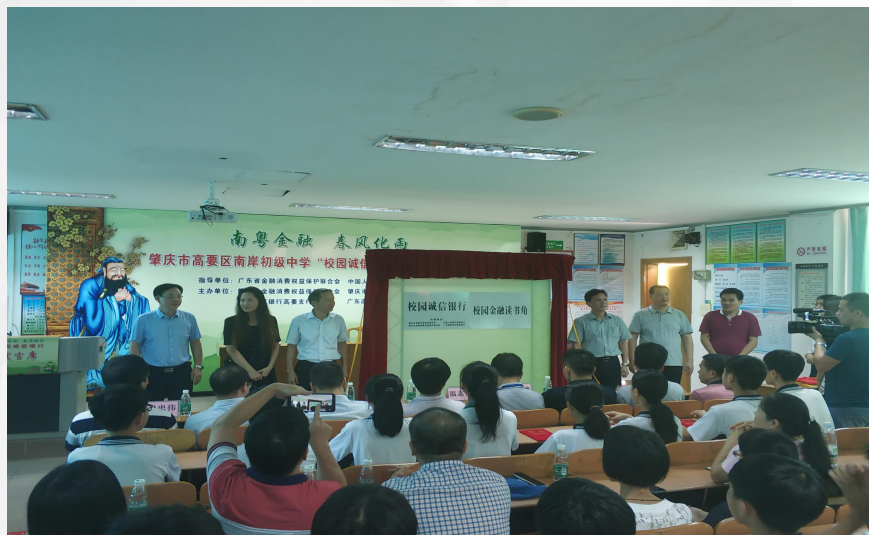
“诚信银行”和金融图书角的揭牌仪式

2019年6月28日肇庆市金融消费者权益保护联合会、人民银行高要支行、广东高要农村商业银行与高要区南岸初级中学共建“校园诚信银行”。各银行机构在我校捐赠金融图书角，开设各项金融知识专题讲座，让师生获取更专业的金融理财知识，提升师生财经素养。