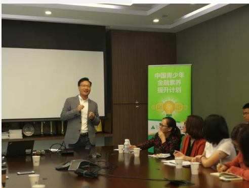
教师金融素养培训工作坊