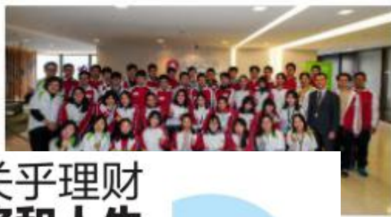
2017广东青少年金融素养研讨会现场合影