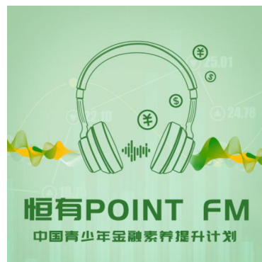
线上金融素养音频系列节目