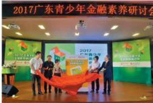
2017广东青少年金融素养研讨会现场合影