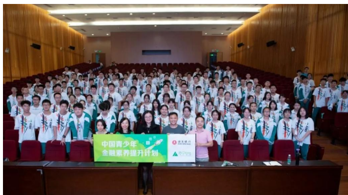
广东省实验中学顺德校区