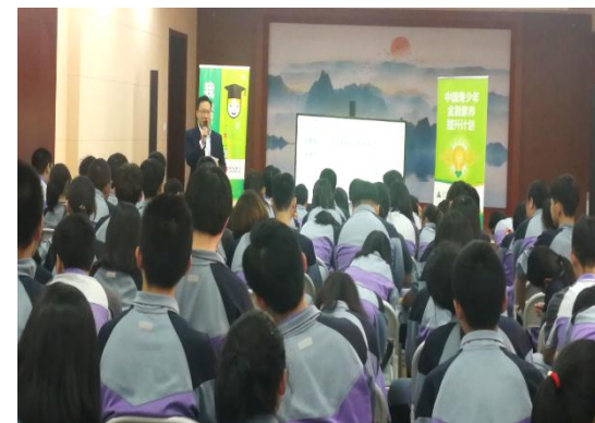
北京理工大学附属中学 通州校区