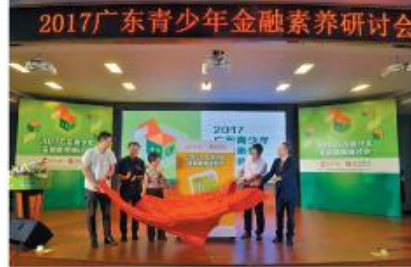
2017广东青少年金融素养研讨会现场剪彩。